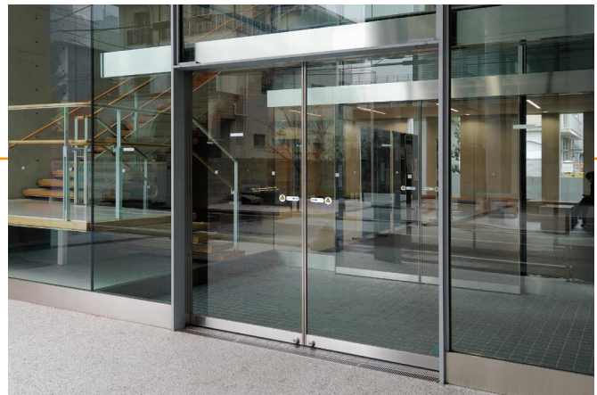
スリムタイトドア(ステンレスヘアライン)

自動ドアに使われている扉には色々な種類がありますが、金属のフレームにガラスが入っているものが一般的です。